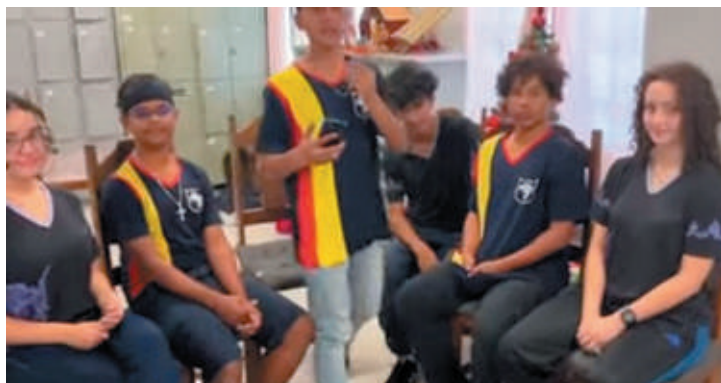
Alunos da Escola Estadual Juvenal Brandão, Guerino Casassanta, Coronel Paiva e abaixo a direita, alunos da cidade de Ottaviano

quantidade de habitantes. Com isso, principalmente pela facilidade na comunicação com o executivo de Ottaviano, como o prefeito Biagio Simonetti, surgiu a ideia da parceria para se tornarem cidades-irmãs. Paulo Henrique ainda destaca que por ser na região de Nápoles e muito próxima ao Vesúvio, o turismo é a principal atividade de lá. “Isso nos chamou bastante atenção, então podemos trabalhar essa parte na área educacional e também do turismo entre as duas municipalidades.” O vereador destaca que diversas localidades já possuem cidades-irmãs. Ele cita, o exemplo de Campinas (SP) que possui 19 cidades-irmãs e Bento Gonçalves (RS) que possui 10.