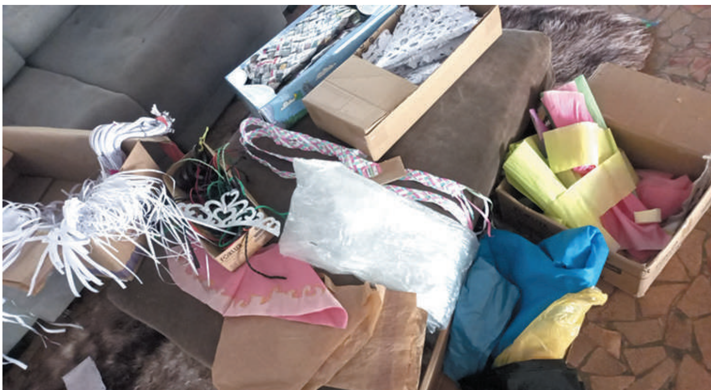
Material usado para fazer as roupas

A ideia do reaproveitamento surgiu a partir do lixo da lixeira que fizeram fora da chácara, e devido ao fato dos moradores colocarem no local montes de papel, de livros e re-